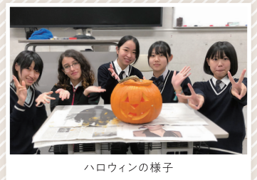
ハロウィンの様子

海外からの留学生を毎年受け入れており、本コースでの3年間は刺激に満ち溢れています。来日・来県した海外の高校生と交流することもあります。