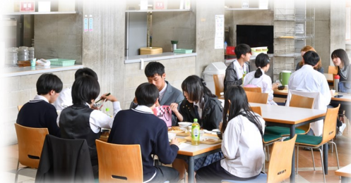
台湾からの修学旅行生とランチタイム