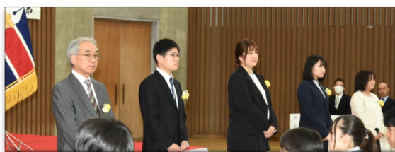
↑ 中学1年部 高校1年部 →