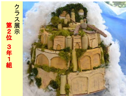
クラス展示 第2位 3年1組