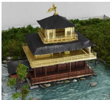
クラス展示 第1位 4年3組