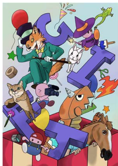
学園祭パンフレットのデザイン画