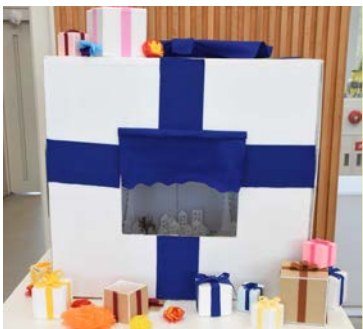
クラス展示 第3位 3年2組